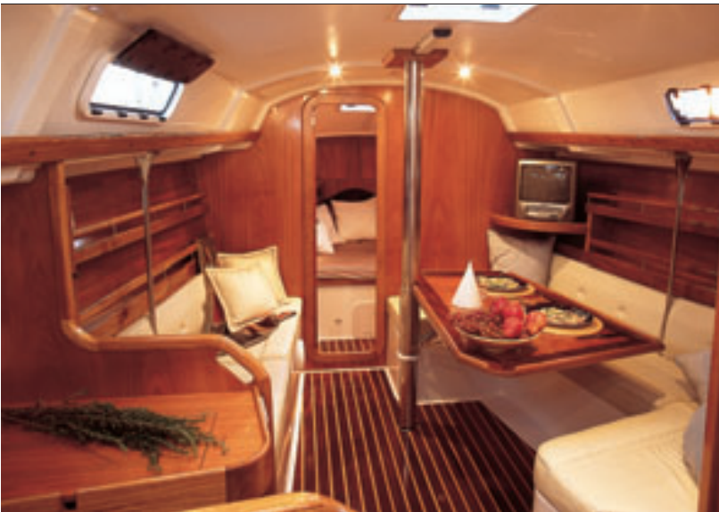
Salão Conforto para seis pessoas nas refeições e um toque de requinte no largo emprego de madeira

Depois de examinar a popa do carro-chefe da Delta, dedicamos nossa análise ao imenso cockpit deste barco de 11 m. O cockpit (conhecido também como poço), por ser a região do barco mais utilizada em países de clima tropical como o nosso, deve ser grande mesmo. Espaço neste local é importante também para deixar as bolsas e outros objetos quando entramos ou saímos do barco. Ciente de que tralhas não faltam num barco de cruzeiro, o projetista Nestor Völker desenhou um grande paiol do tipo duplex (dois andares) sob o assento do banco de bombordo. Ele comporta um bote inflável dobrado, uma balsa salva-vidas, defensas, velas, espias, material de limpeza, equipamento de mergulho e/ou pesca e por aí vai. Outra ótima solução existente no Delta 36 é o acesso no piso do cockpit que deixa os cabos do leme (gualdropes) à mostra. Quem já passou pela situação de perder o comando do leme pelo rompimento do cabo de comando sabe a dureza que é ter de consertar o sistema em meio a uma velejada. Mas, por causa desse acesso, as dificuldades foram bastante minimizadas no Delta 36. ▶