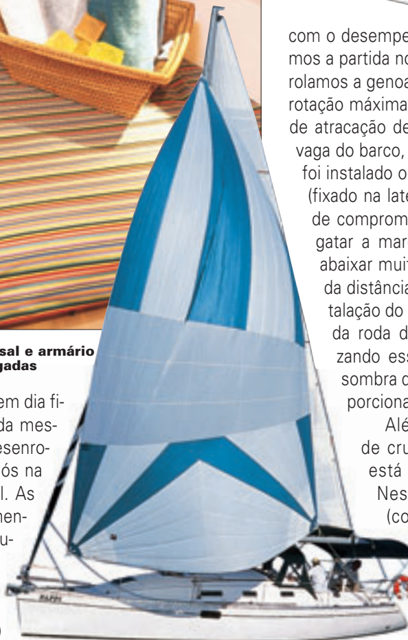
Balão Spinnaker assimétrico possibilita bom desempenho com vento de través e pela alheta

tor, abrimos as velas — velejar hoje em dia ficou simples, bastando tirar a capa da mestra, içá-la até o tope do mastro e desenrolar a genoa — e navegamos a 5,5 nós na orça, sempre com a proa para o sul. As ferragens e os cabos estão corretamente posicionados, facilitando o manuseio das velas. O leme é bem leve e o barco responde rapidamente às manobras, tanto nas cambadas por de vante (com o vento pela proa) quando nas cambadas em roda (com o vento pela popa). Satisfeitos