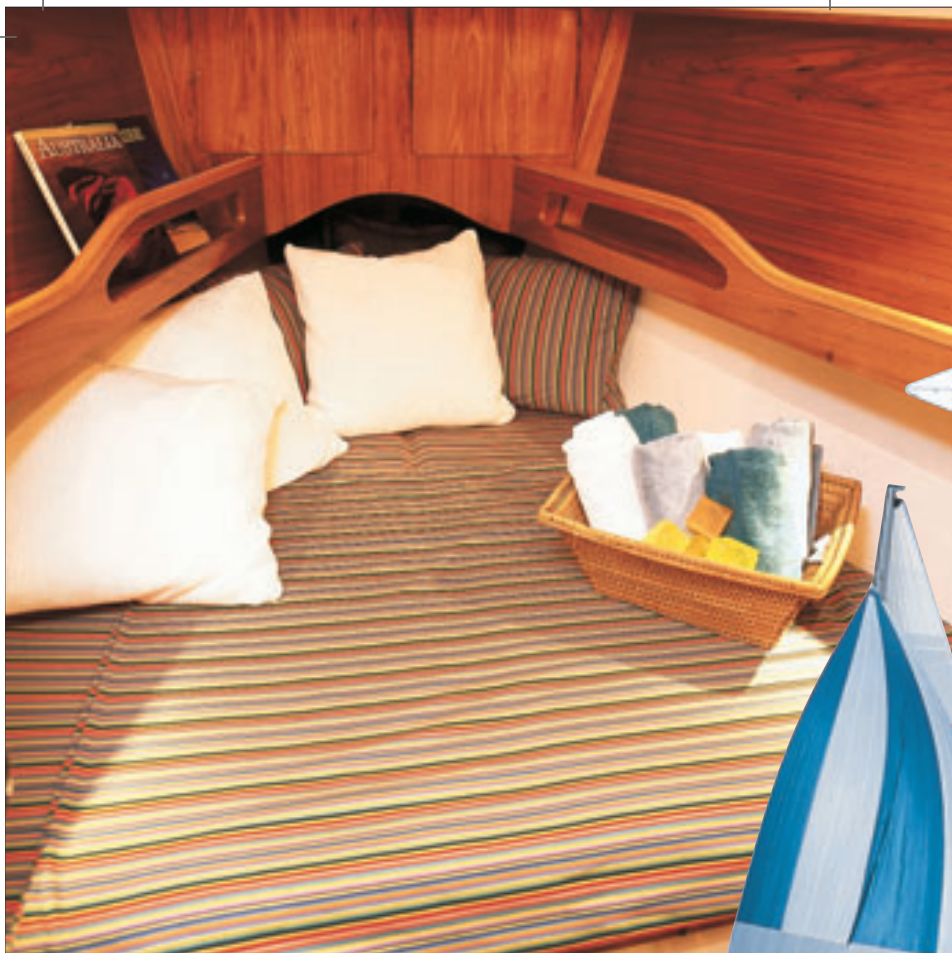
Proa Camarote privado para um casal e armário com cabideiros para estadias prolongadas

tor, abrimos as velas — velejar hoje em dia ficou simples, bastando tirar a capa da mestra, içá-la até o tope do mastro e desenrolar a genoa — e navegamos a 5,5 nós na orça, sempre com a proa para o sul. As ferragens e os cabos estão corretamente posicionados, facilitando o manuseio das velas. O leme é bem leve e o barco responde rapidamente às manobras, tanto nas cambadas por de vante (com o vento pela proa) quando nas cambadas em roda (com o vento pela popa). Satisfeitos